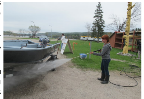
Début du lavage à l'occasion de l'ouverture de la pêche

En attendant, des actions de sensibilisation et de lavage ont d'ores-et-déjà eu lieu, notamment lors de la fin de semaine de l'ouverture de la pêche à l'Île du Long Sault à Témiscaming et d'autres actions vont être menées dès cet été. Une machine à pression de location est utilisée pour ces événements.