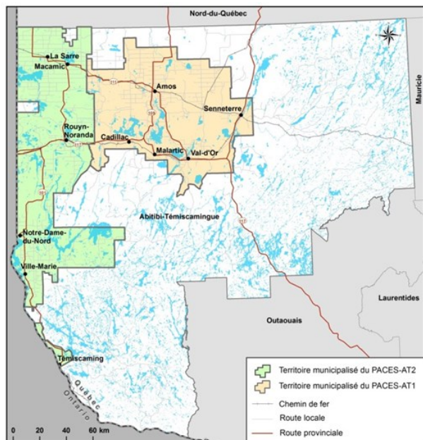
Localisation générale des PACES-AT

L'eau souterraine constitue une ressource stratégique tant à l'échelle planétaire qu'au niveau de la province et de la région. Depuis 2008, le Québec s'est doté du Programme d'Acquisition de Connaissances sur les Eaux Souterraines, lequel a été initié dans la perspective de parfaire les connaissances relatives à la ressource afin d'en assurer la protection et l'exploitation durable. Au total, 13 projets régionaux ont été financés à l'échelle de la province alors que le Groupe de Recherche sur l'Eau Souterraine de l'Université du Québec en Abitibi-Témiscamingue a bénéficié d'un financement totalisant plus de 2,3 M$ pour la réalisation de deux Projets d'Acquisition de connaissances sur les Eaux souterraines de l'Abitibi-Témiscamingue (PACES-AT1 et PACES-AT2; Figure 1), notamment grâce à l'implication de partenaires régionaux.