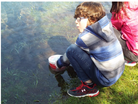
Aquaculture à Val d'Or

J'adopte un cours d'eau est toujours un succès année après année auprès des jeunes et des enseignants. Grâce à ce programme, plusieurs cours d'eau, dont la qualité est souvent méconnue, ont pu être échantillonnés. Les données sont plus qualitatives que quantitatives, mais cela permet d'avoir un meilleur portrait de notre région et ainsi de pouvoir prendre des actions ciblées pour la protection du milieu.