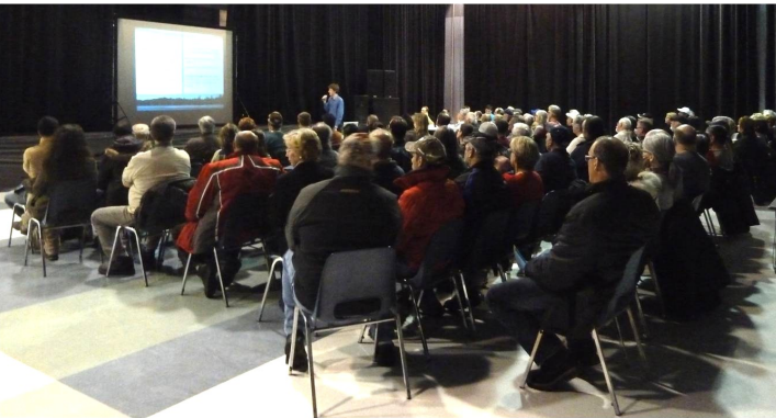
Rencontre publique du 24 mars 2014 à Témiscaming

Ensuite, c'est un comité de concertation constitué sur une base volontaire expressément pour le projet qui a déterminé des propositions pour l'avenir du lac. Composé de représentants de tous les horizons : municipalités, secteur économique mais aussi milieu environnemental et communautaire, ce comité garantissait la représentativité du milieu. Des actions sur des sujets aussi importants que l'habitation permanente et saisonnière, la pêche et les populations de poissons, la plaisance et l'utilisation du lac ou les activités industrielles et commerciales ont été proposées par ce comité.