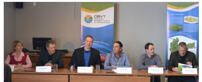
Dévoilement du PDE lors de la conférence de presse du 14 février 2014

Toutes les informations concernant le PDE ainsi que les documents sont disponibles sur le site internet de l'OBVT: http://obvt.ca/plan/pde